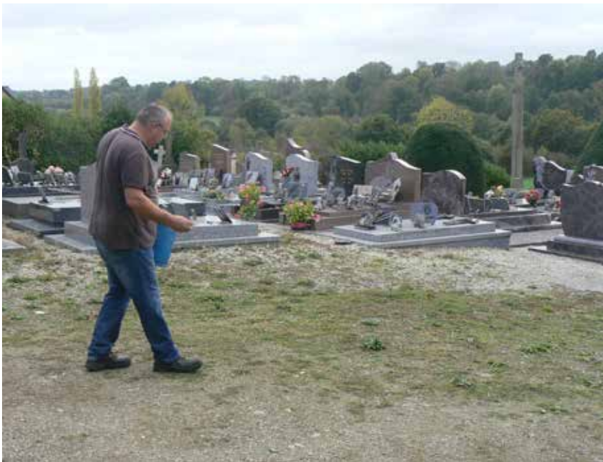
Le maire semant le gazon composé de fétuque et de raygrass.