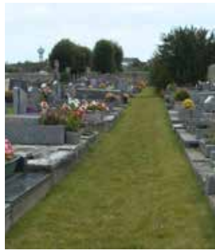
Un exemple de cimetière enherbé