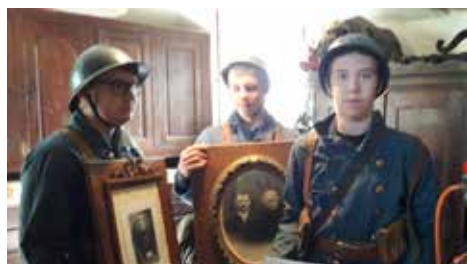
Photo : le 11 novembre en coulisse

Vous avez des idées d'articles à faire paraître, envoyez-les à : mairiestesuzannesur-vire@wanadoo.fr ou déposez-les à la mairie.