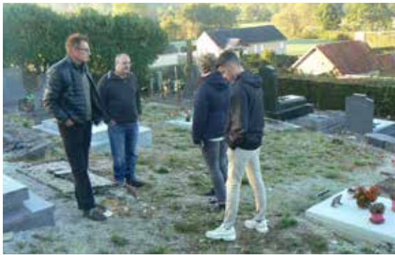
Les élus et les professionnels du secteur examinent le sol du cimetière et les possibilités d'implantation

C'est pourquoi certaines allées ont été ensemencées en octobre dernier et durant l'hiver un couvert végétal va s'installer sur les cailloux présents. Ce gazon spécial qui ne pousse que très peu ne demande qu'une tonte ou deux par an, il ne nécessite ni engrais ni arrosage. En fonction des résultats obtenus et constatés au printemps, il sera alors décidé d'étendre cet enherbement à d'autres parcelles du cimetière.