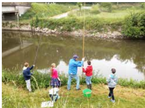
Atelier pêche avec l'APPMA de Saint-Lô