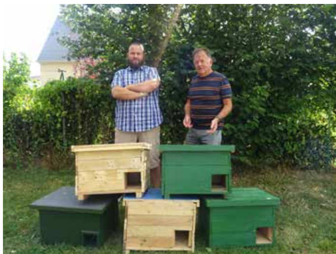
Les bénévoles présentent les abris à hérissons.