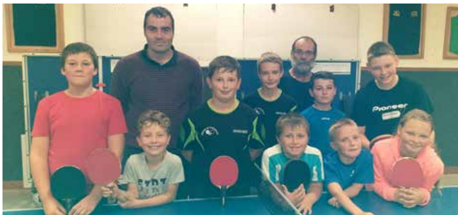
Le groupe des jeunes 2019 - 2020

22 licences traditionnelles (compétition) et 8 licences promotionnelles (loisir).