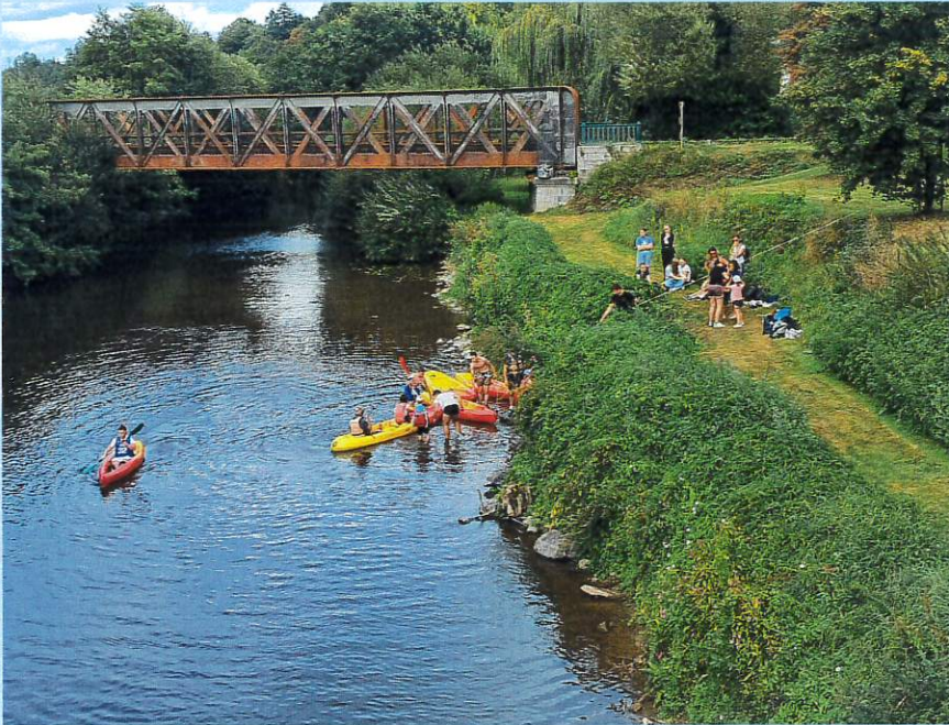
Fête des activités en famille