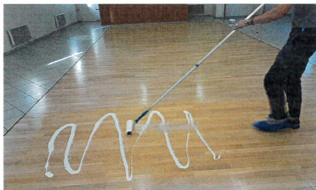
Réfection du parquet de la salle des fêtes