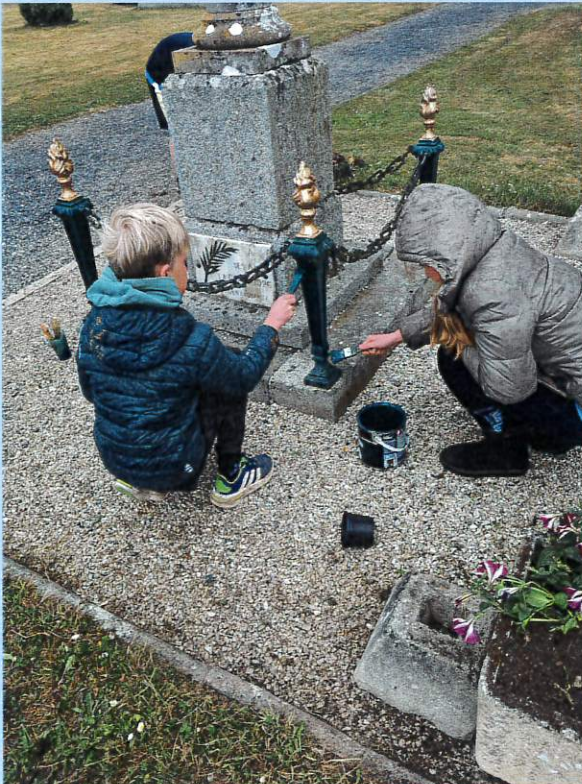
Entretien et fleurissement du monument aux morts.