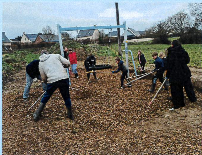
Mise en place des jeux