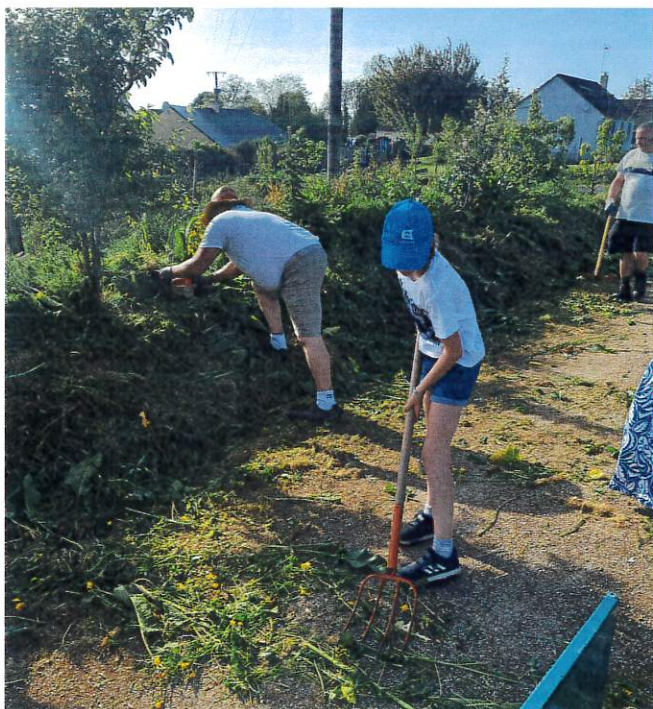
Entretien de la commune