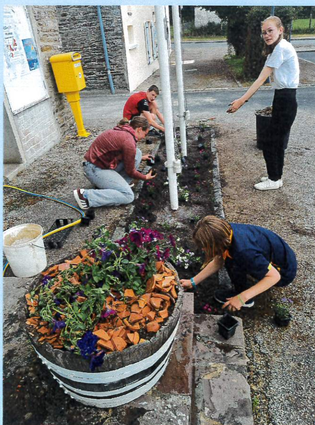
Fleurissement de la commune