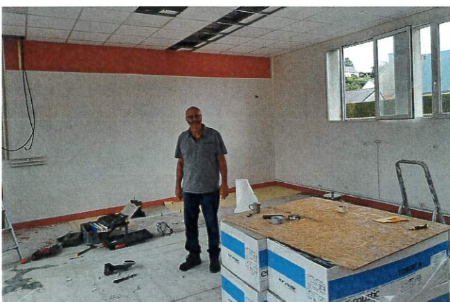
Rénovation énergétique des écoles