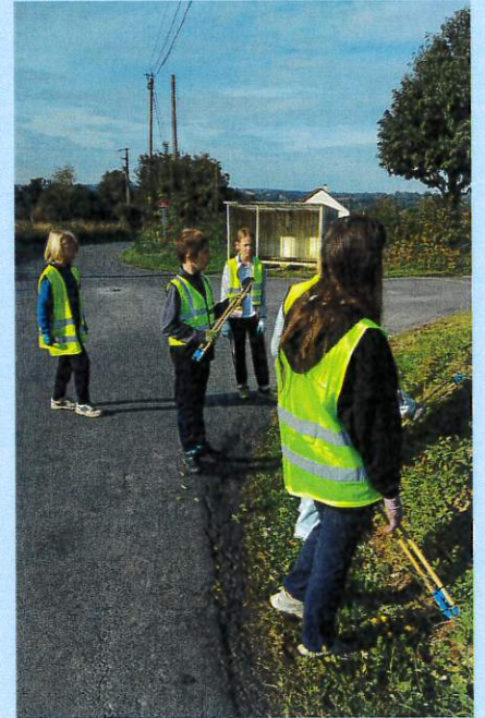
Nettoyage des rues