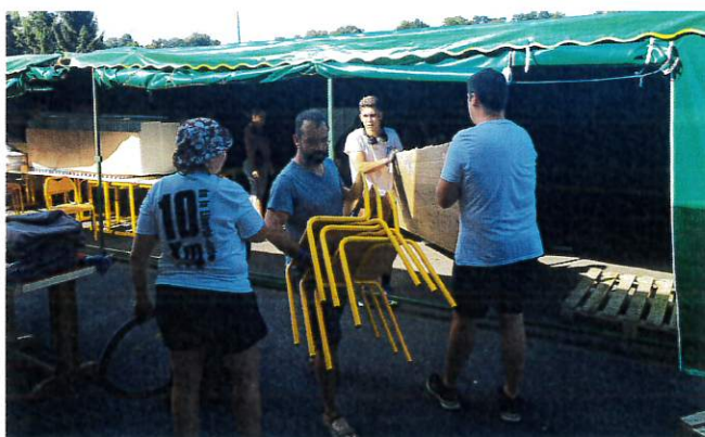
Déménagement du mobilier de l'école le temps des travaux