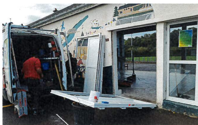
Sécurisation des portes d'entrée de l'école